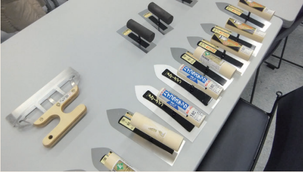
塗装に使った道具